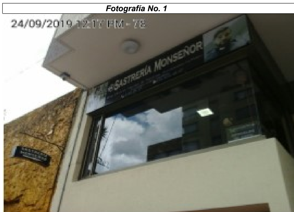
Fachada del establecimiento de comercio.