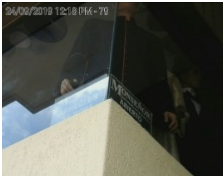
Fachada del establecimiento PEV en ventanas.